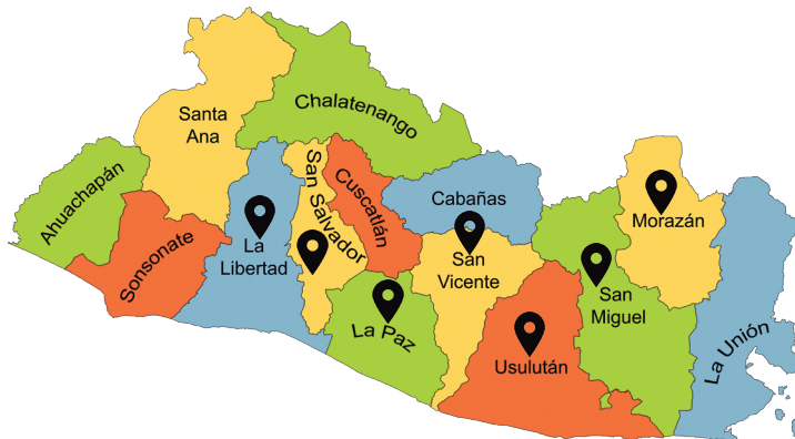
ILUSTRACIÓN 1 - MAPA DE LOS MUNICIPIOS INVOLUCRADOS EN LA INVESTIGACIÓN