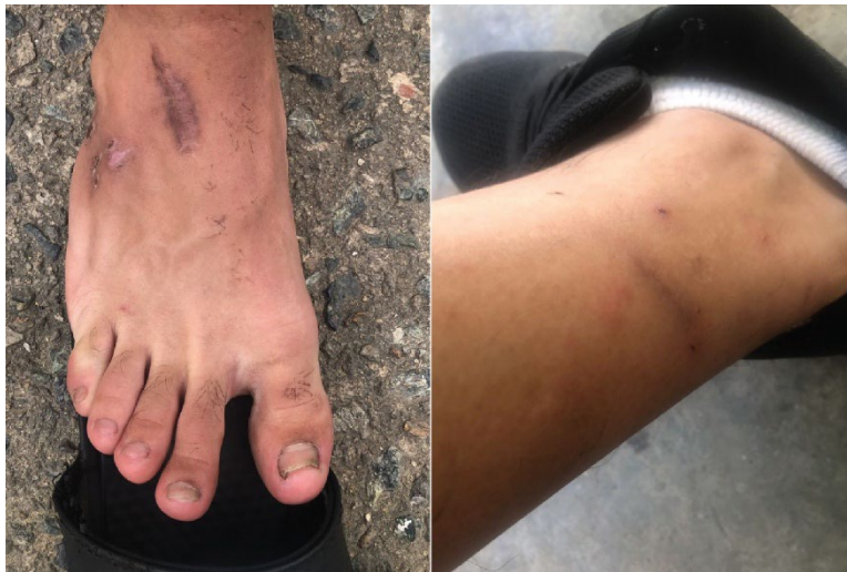
Fotos proporcionadas por Wilson L., que muestran las lesiones en su pierna y pie. © 2025 Privado.

“Al ratico que se fue la gringa entraron custodios a pegarnos”, dijo Tirso Z. “Lo de siempre, hincados afuera en el pasillo y llevamos bastones, puños, patadas, palmadas en la cabeza.... Eso yo creo que duró como unos 7 minutos y luego a las celdas”. 136